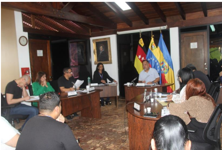
Propuesta de Acuerdo donde se repudian todos los actos de violencia en la Jurisdicción del Municipio El Hatillo.