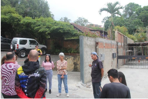
Inspección en La Lagunita