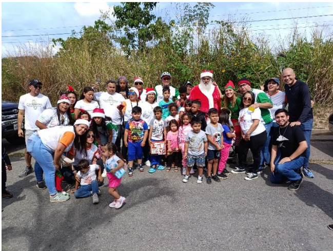
Entrega de juguetes a los niños de comunidades del Municipio.