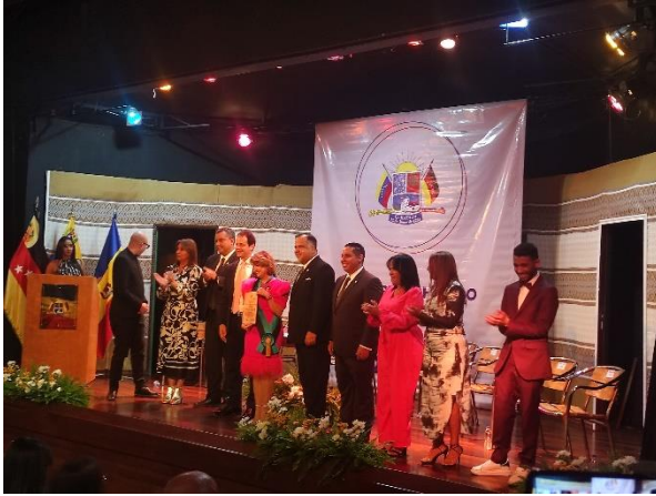
Sesión Solemne conmemorativa al Día de la Mujer.