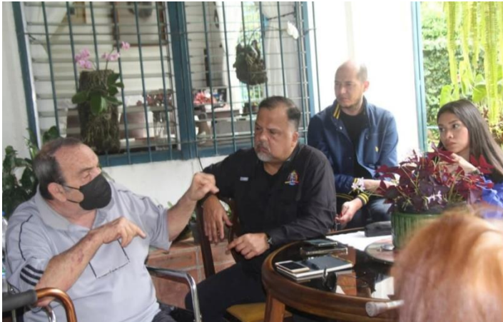
Reunión con vecinos de la Lagunita de la Comisión Permanente de Legislación y la Comisión Permanente de Ambiente.