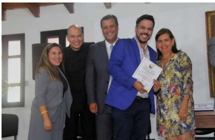
Sesión Solemne Conmemorativa al Dia del Enfermero.