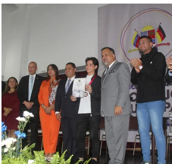
Sesión Solemne conmemorativa al Dia de la Juventud.