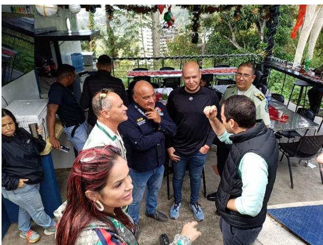
Entrega de juguetes a funcionarios del Instituto Autónomo de Policía del Municipio El Hatillo.