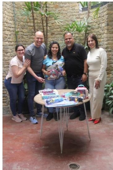
Entrega de juguetes a funcionarios del Concejo Municipal