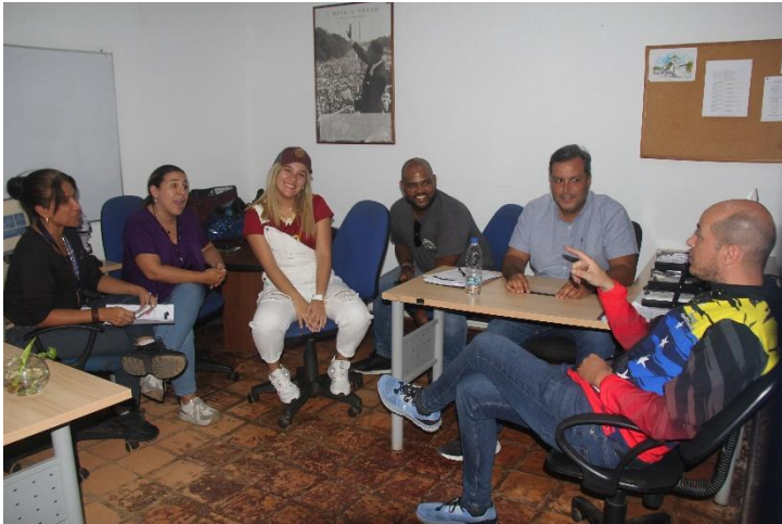
Reuniones en el Concejo Municipal.