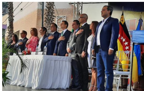
SESION SOLEMNE CONMEMORACION DEL DE LA VIRGEN DE FATIMA