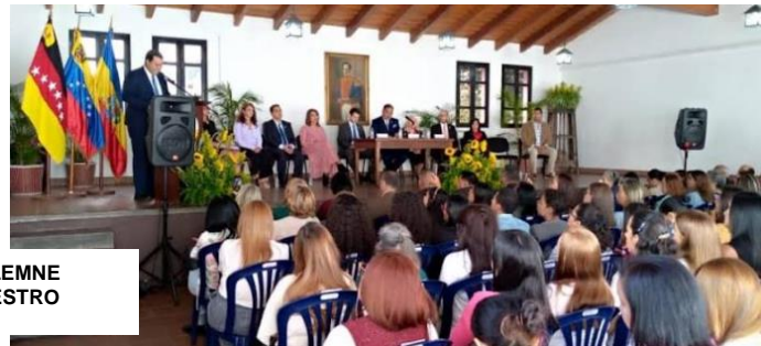
SESION SOLEMNE DIA DEL MAESTRO