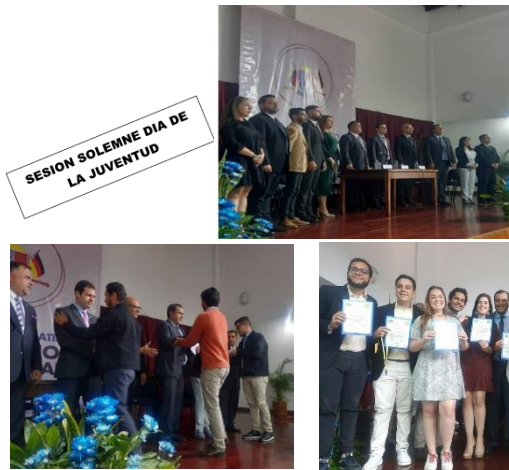
SESION SOLEMNE DIA DE LA JUVENTUD